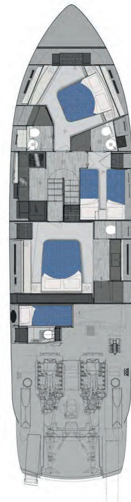
Lower Deck | 3 cabins std layout