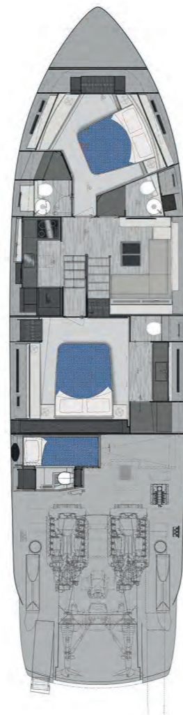
Lower Deck | 2 cabins opt layout